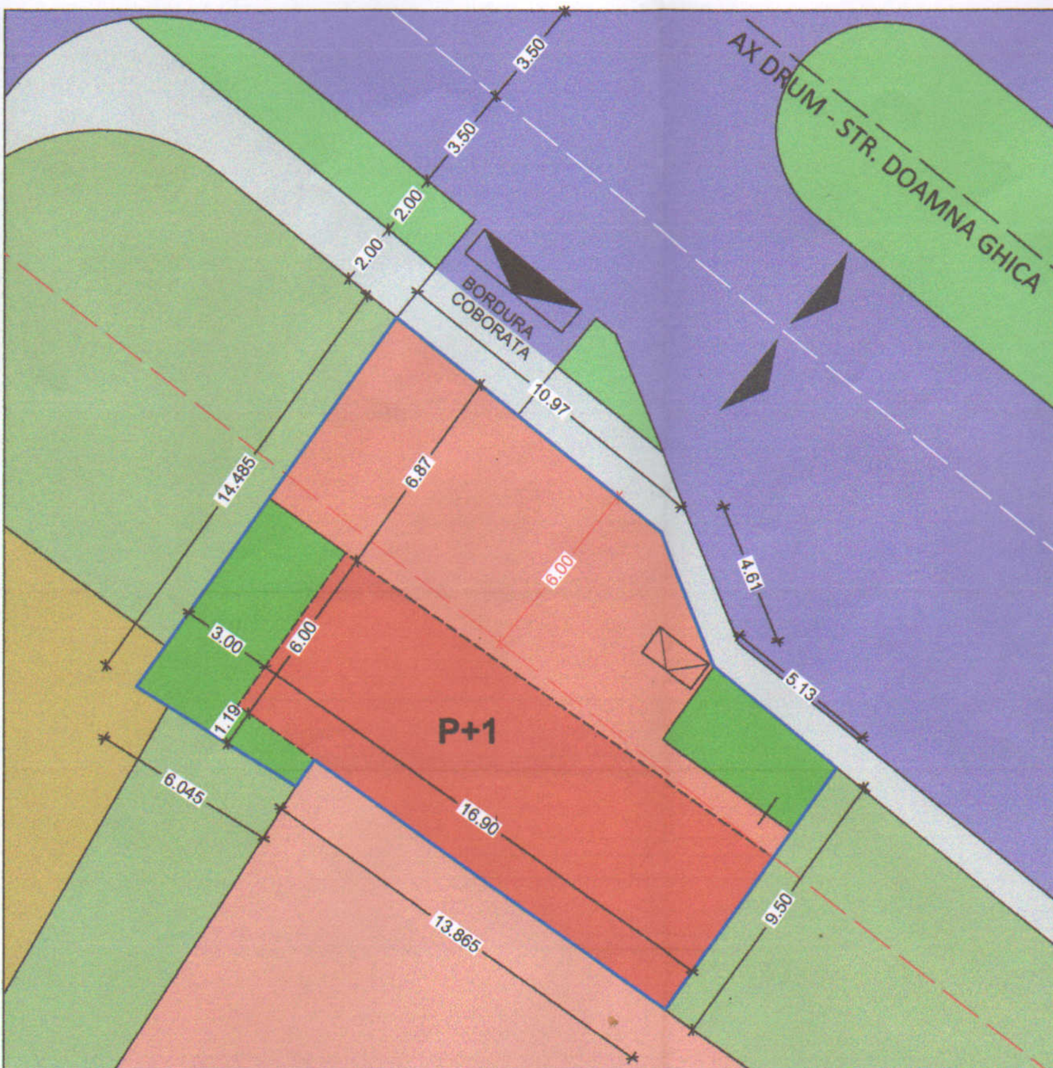
DETALIU REGLEMENTARI URBANISTICE scara 1:200

OCPI Bucuresti, B-dul Expozitiei nr. 1A, sector 1, Bucuresti Data: 2019 Intocmit: Mihaela Radu