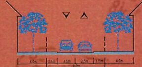
PROFIL 1 - 1 SCARA 1:500