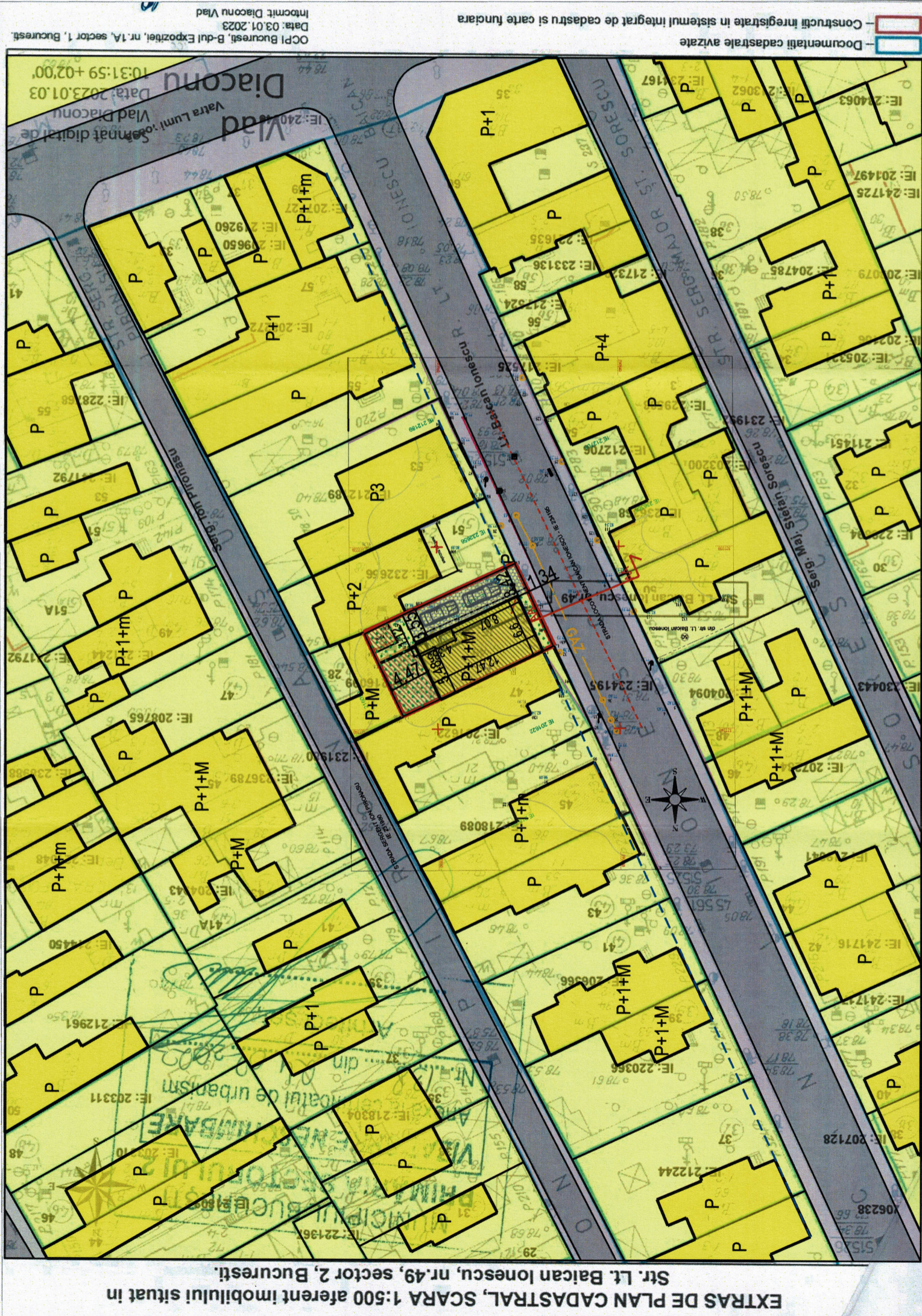
EXTRAS DE PLAN CADASTRAL, SCARA 1:500 aferent imobilului situat in Str. Lt. Baican Ionescu, nr.49, sector 2, Bucuresti.